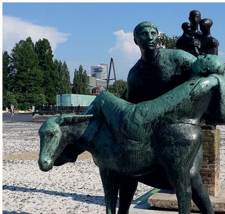
Afbeelding 4. De Barmhartige Samaritaan

Het dubbelgebod onze naaste lief te hebben als onszelf blijft onverminderd van kracht, in het recht, de rechtstheologie, het kerkrecht en daarbuiten. Niemand is te groot om een kleine barmhartige samaritaan te zijn. Heb uw naaste lief als uzelf!